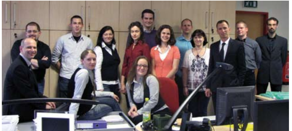
Das Team der Express Interfracht

Die von Express Interfracht am stärksten frequentierten Häfen sind Rotterdam, Hamburg und Bremerhaven im Norden, Triest und Koper an der Adria. Eigene Sammelcontainerdienste gibt es ab Hong Kong und Shanghai direkt bis Wien. In China werden Anbindungen von allen wichtigen Häfen und Wirtschaftszentren angeboten. Ebenfalls zwischen Österreich und Asien organisiert Express Interfracht eigene Luftfrachtsammelverkehre. Dabei deckt man österreichische Flughäfen ab, arbeitet aber auch mit den Luftfrachtdrehscheiben Frankfurt, Amsterdam und Paris zusammen.