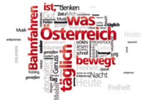
Wortwolke als Kampagnen-Sujet

schlafen oder auch einfach nur die Fahrt genießen.