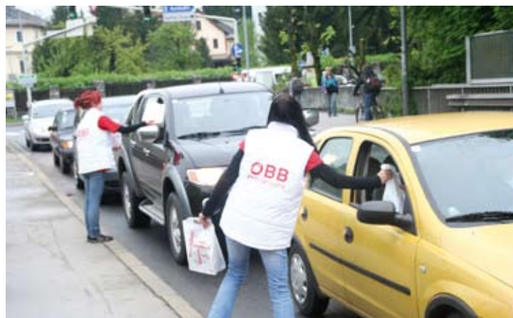
Frühstückssackerln für wartende AutofahrerInnen

freundliche ÖBB-Promotionsteams an vor der Ampel wartende AutofahrerInnen Frühstückssackerln. Neben Kipferln und Eistee finden sich darin ein Flyer in Laptop-Form, ein Erfrischungstuch und ein Sudoku-Heft samt Kugelschreiber. Außerdem dabei: ein ÖBB-Probefahrt-Ticket – damit jeden(r) Bahnfahren selbst erleben kann.