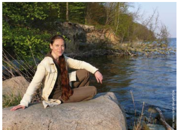
Sie können sich schützen! Laufen Sie in von Zecken befallenen Regionen nicht barfuß durch die Wiese. Tragen Sie bei Waldspaziergängen lange Hosen und hohe Schuhe.