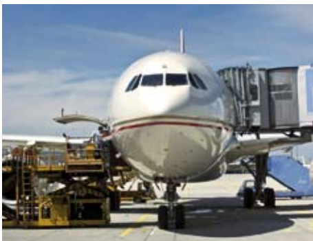
Weltweiter Containertransport mit Flugzeug und Schiff

Zu den Domänen der Container- und Luftfrachtgruppe von Express Interfracht zählen nicht nur der klassische In- und Export, sondern auch sogenannte Cross Trades, wo für viele Handelsunternehmen Transporte zwischen verschiedenen Ländern und Kontinenten arrangiert werden.