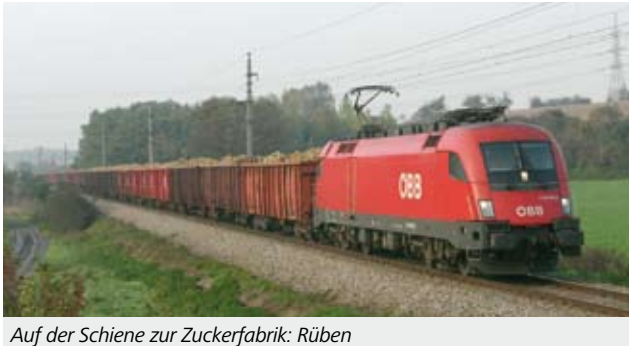
Auf der Schiene zur Zuckerfabrik: Rüben

St. Pölten mit der bestehenden Bahnlinie Tulln–Herzogenburg verknüpft, den Ablauf. Drittens gab es Probleme im Wagenstellungsbereich, und viertens hatte Kunde AGRANA mit diversen Defekten in den Zuckerfabriken zu kämpfen. Trotzdem gelang es dem RCA-Team, alle Unwägbarkeiten zu beseitigen und die Rübentransporte erfolgreich und pünktlich abzuwickeln.