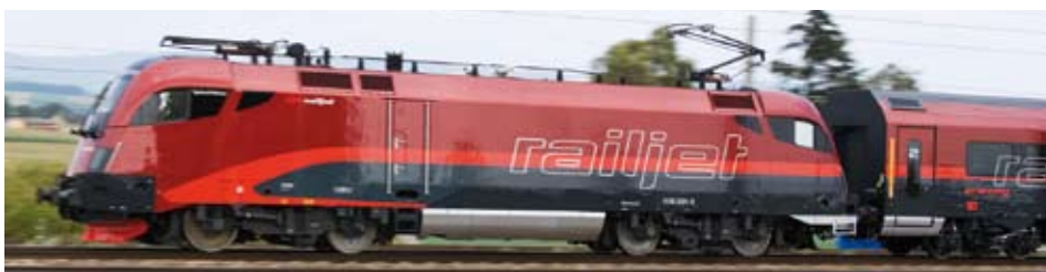
Toller Service im railjet