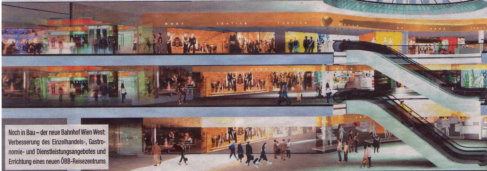
Noch in Bau – der neue Bahnhof Wien West: Verbesserung des Einzelhandels-, Gastronomie- und Dienstleistungsangebotes und Errichtung eines neuen ÖBB-Reisezentrums