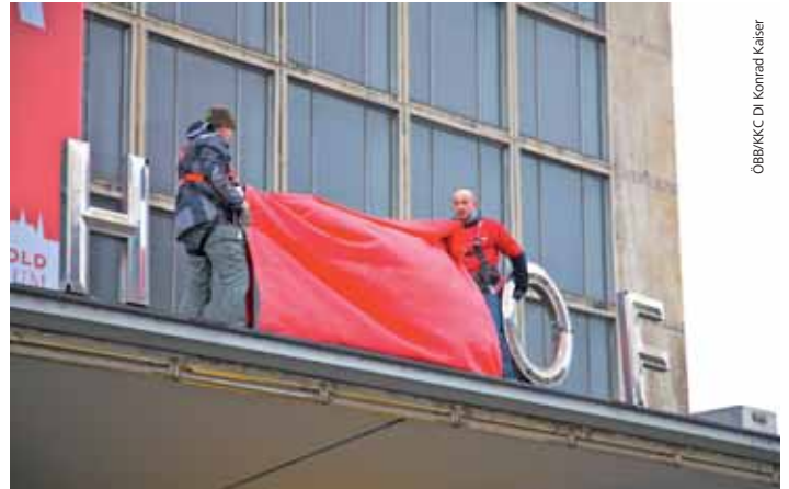
Vor dem Abbruch: Räumung des Wiener Südbahnhofs

lage, die sich unter Aufnahmegebäude und Bahnsteigkörper des Ostbahnhofs befindet. Die bis zu drei Meter dicken Stahlbetonwände werden zuerst mit Hydraulischen zerschnitten und dann mit fünf Tonnen schweren Abbruchhämmern abgetragen.