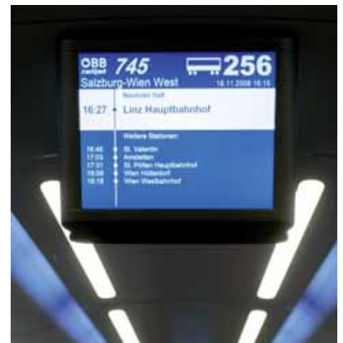
Neu im railjet: Kundeninfo per LiNK

PV-S&IT, unter der Leitung von Christian Pettauer, arbeitet weiterhin mit viel Engagement am Ausbau der Kundeninformationssysteme. 2010 sollen auch die DESIRO-Fahrzeuge mit Echtzeitinformationen ausgestattet werden.