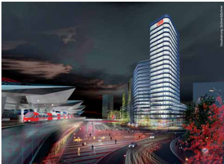
Die neue ÖBB-Konzernzentrale

Die Wiener Architekten Zechner & Zechner gingen aus diesem Wettbewerb als Sieger hervor. Ihr Entwurf zeichnet sich – neben der Erfüllung aller wirtschaftlichen und funktionalen