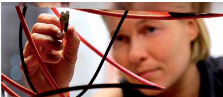
IKT des ÖBB-Konzerns in einer Hand

Der ÖBB-Konzern braucht eine hochwertige und kostengünstige IKT-Infrastruktur und eine gemeinsame Strategie für IKT-Services. Durch die Bündelung aller IKT-Kompetenzen in einer Gesellschaft vermeidet man Doppelgleisigkeiten und man kann die Servicequalität weiter verbessern sowie Kosten senken. Ziel ist die Verbesserung der IKT-Unterstützung und Betreuung aller Konzerngesellschaften sowie der externen EVU.