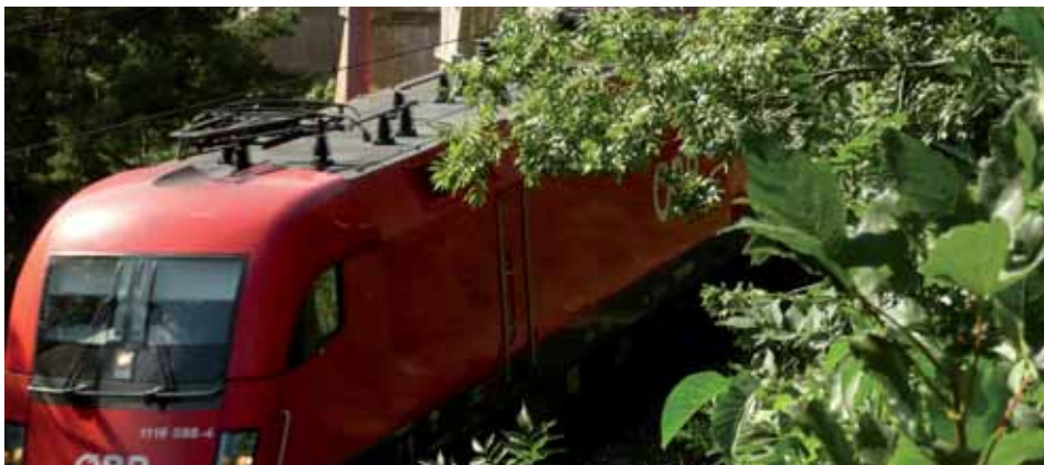
Ingenieurb biologische Maßnahmen schon bei der Semmeringbahn

Bei Böschungen verwendet man Pflanzen, die mit ihren Wurzeln den Boden festigen, im Wasserbau macht man sich die hydraulische Wirkung von Pflanzen zum Schutz vor Erosion zunutze, Mikroorganismen verbessern das Bodengefüge.