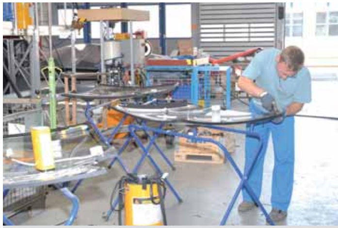
Zertifizierte Montage von Taurus-Stirnscheiben im TS-Werk Linz

Belastung der Dichtnaht und ist außerdem elastischer als herkömmliche Schweißnähte.