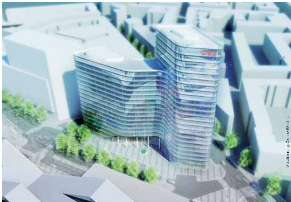
Dynamisch gerundete Form symbolisiert Bewegung.

Der Baustart ist 2011. Das Bauwerk soll zeitnah mit dem neuen Bahnhofsgebäude, den Wohnprojekten der Stadt Wien, einem Teil des Parks und auch der zweiten großen Konzernzentrale, jener der Erste Group im nördlichen Areal am Wiedner Gürtel, 2014 fertiggestellt sein.